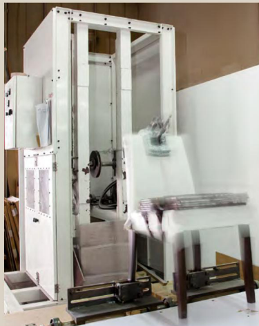
繰り返し衝撃試験を実施中のカトレア。

様々な人が様々な状況で使う業務用家具。それゆえに製品の強度試験もまた、想定外のレベルまで行います。通常、木製イスでは4千回実施して問題なければ日本国内の基準 (JIS規格) に準拠していると言えますが、アダルではその5倍となる2万回のテストを実施 (一部除く)。圧倒的な強度と耐久性を支えるのは、アダル独自の技術。接合部に小さな溝を走らせることで接着剤を行き届かせる「斜線ホゾ」は、その一例です。細部にわたる配慮がアダルの家具の品質を実現しています。