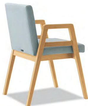
01色 張地 MAXWELL 30(Bランク)