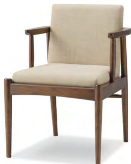
T2色 張地 MAXWELL 04(Bランク)