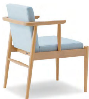
T1色 張地 MAXWELL 30(Bランク)