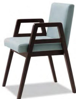
06色 張地 MAXWELL 30(Bランク)