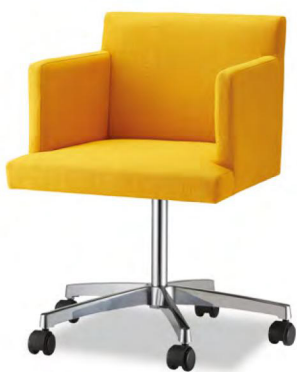
アームチェア シルバー 張地 MAXWELL 15 (Bランク)