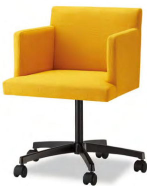
アームチェア ブラック 張地 MAXWELL 15 (Bランク)