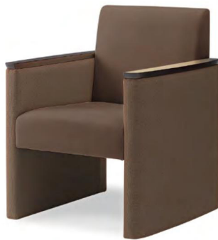
06色 張地 ブラハ PU-12(Aランク)