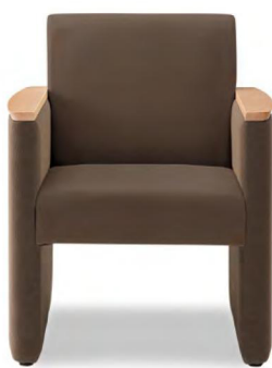
01色 張地 ブラハ PU-12(Aランク)