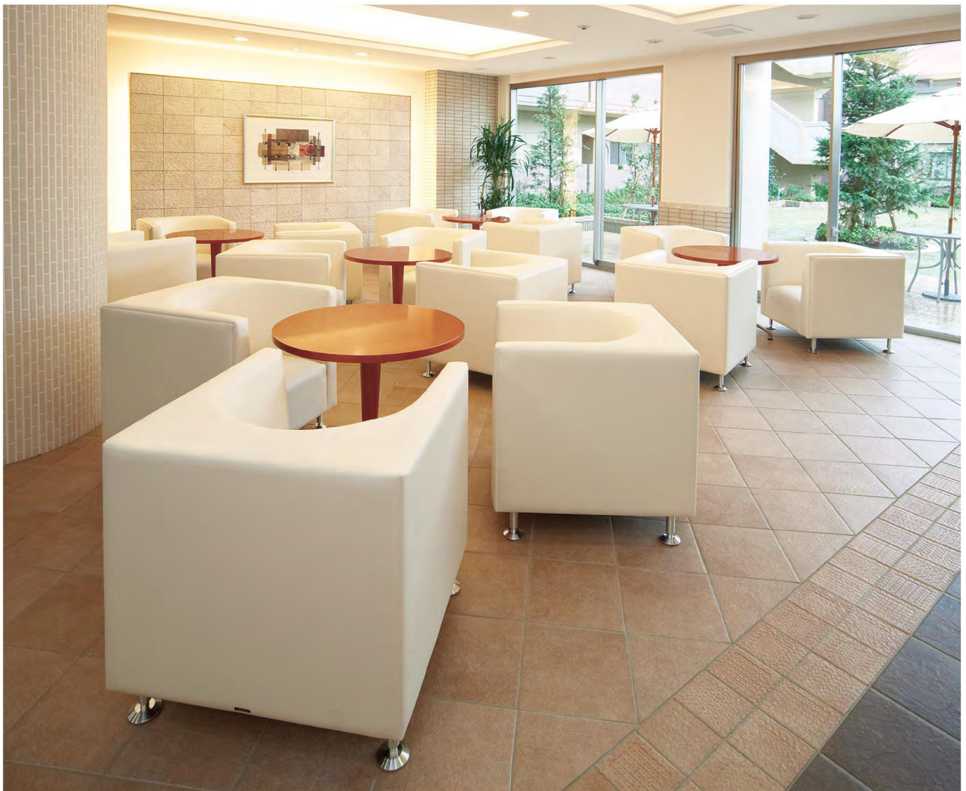
キュービックⅡ メタル脚タイプ