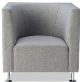
メタル脚タイプ 張地 N.C. 125(Cランク) □LIMITED