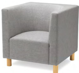
木製脚タイプ 張地 N.C. 125(Cランク)