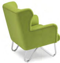
シルバー脚 張地 BLAZER Bryanston CUZ53 (Eランク)