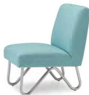
シルバー脚 張地 マニエラ L-8272 (Bランク)