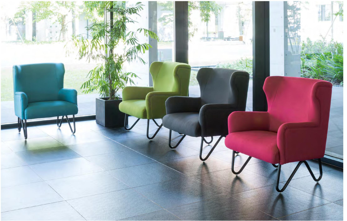
リュゼ リトルウイング ブラック脚

輪郭をなぞるように施されたダブルステッチがやわらかなシルエットをつくり出します。優美な曲線を描くスチール製の脚もポイントです。