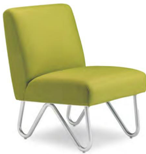
シルバー脚 張地 マニエラ L-8261 (Bランク)