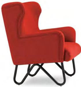
ブラック脚 張地 BLAZER Goldsmith CUZ39 (Eランク)