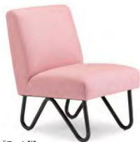
ブラック脚 張地 マニエラ L-8247 (Bランク)