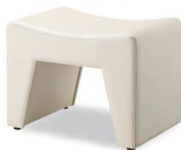
1人掛 張地 アイコン IC0-3(Aランク)