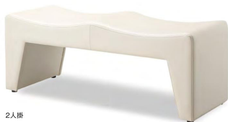
2人掛 張地 アイコン IC0-3(Aランク)