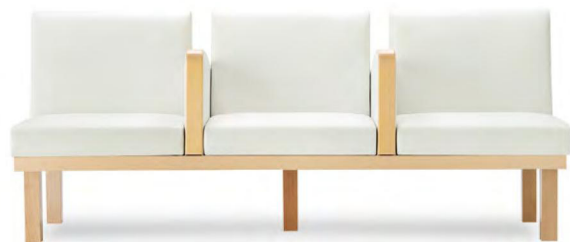
張地 アイコン ICO-1(Aランク)