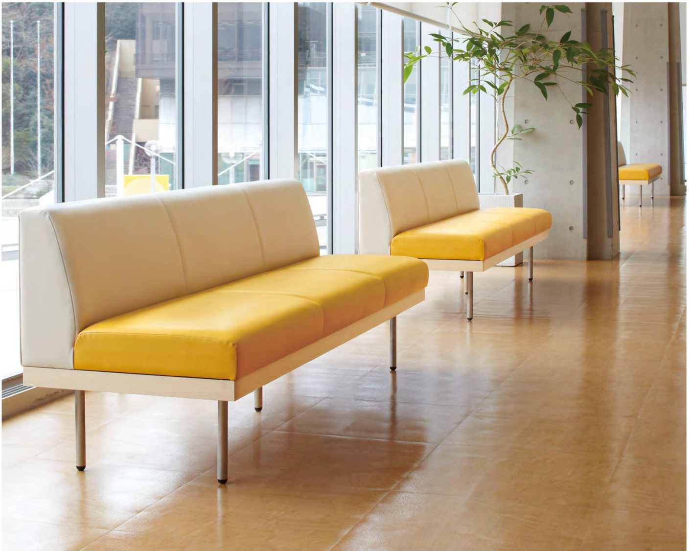
モジュレックス CASE6 S3004-30NS(P.311)