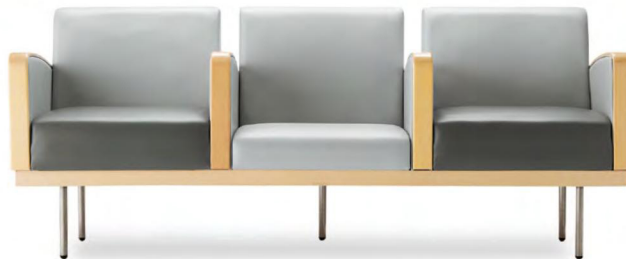
張地(整形外科シート) 青・肘(ミドルバック1シーター) 青・肘・座 ハイラルゴ L-8602(Bランク) (整形外科シート) 座 ハイラルゴ L-8617(Bランク)