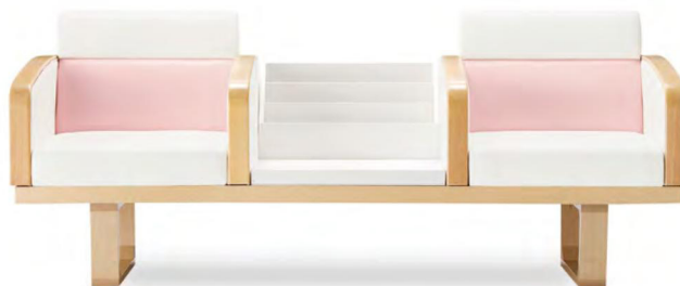
張地 背・座・肘 アイコン ICO-1(Aランク) 背下 アイコン ICO-23(Aランク)