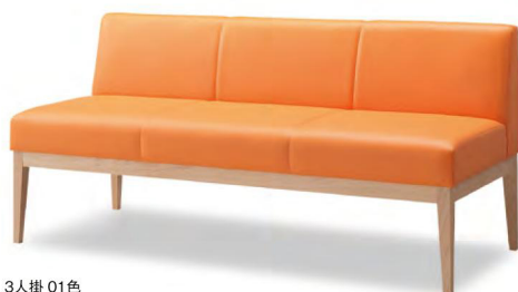
3人掛 01色 張地 アイコン ICO-24 (Aランク)