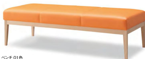
ベンチ 01色 張地 アイコン ICO-24 (Aランク)