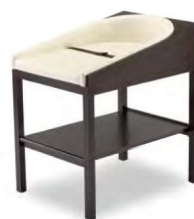
張地 アイコン ICO-2(Aランク)