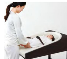
ベルト使用イメージ