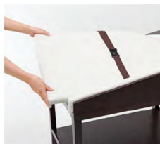
マットは取りはずし可能