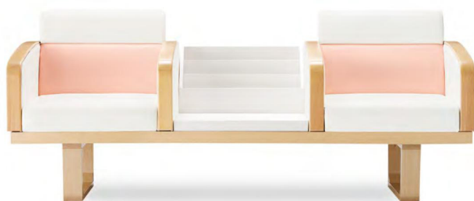
張地 背上・肘・座 アイコン ICO-1 (Aランク) 背下 アイコン ICO-23 (Aランク) (P.312 CASE7 木製脚 Bタイプ)

お腹が大きい妊婦さんの身体に配慮し、お腹への負担を和らげ、腰をしっかり安定させます。体が沈み込みすぎないので立ち上がりもラクです。