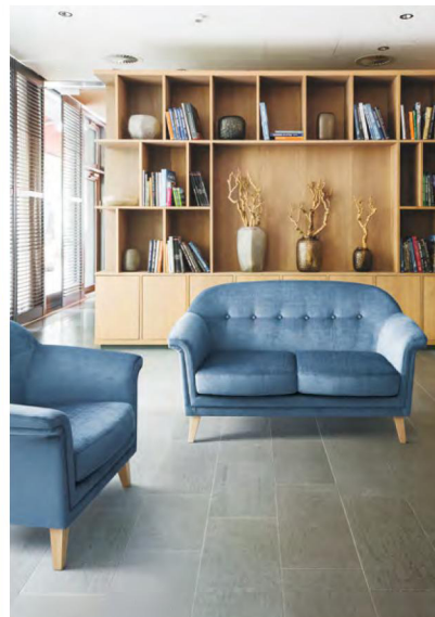
スージー >> P.269 / スピリットAC

ファブリック詳細 スピリットAC >> P.474 ノルディウォームIIAC >> P.474