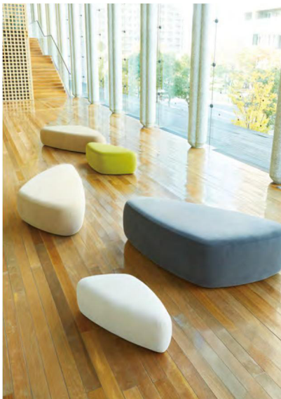
ロト >> P.334 / ノルディウォームIIAC