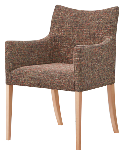
ナチュラル 張地: 布・エディ・8(D) ¥67,700