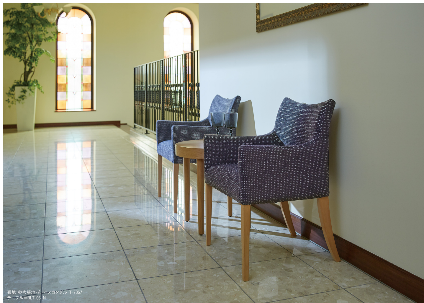
張地: 参考張地・布・イスカンドル・T-7357 テーブル=RLT-03-N