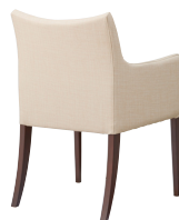
ダークブラウン 張地: レザー・シャバクロ・L-8176(B) ¥61,900