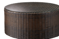
ロードスラウンドテーブル

*冬季の気温が低い状況下ではガラス天板を固定する樹脂製の吸盤の柔軟性が損なわれ 吸着力が落ちる場合があります。予めご了承下さい。