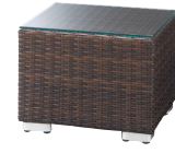
ロードサイドテーブル