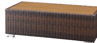
ロードステーブル2型