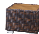
ロードサイドテーブル2型