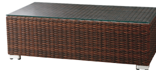
ロードステーブル