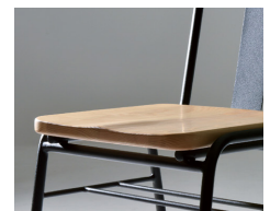
座板は座割り加工されています。