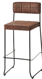
張地: 布・エームマスター・マホガニー(D) ¥51,400