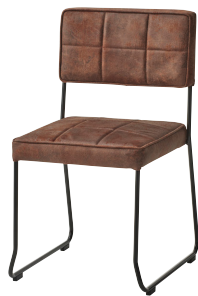
張地: 布・エームマスター・マホガニー(D) ¥44,400