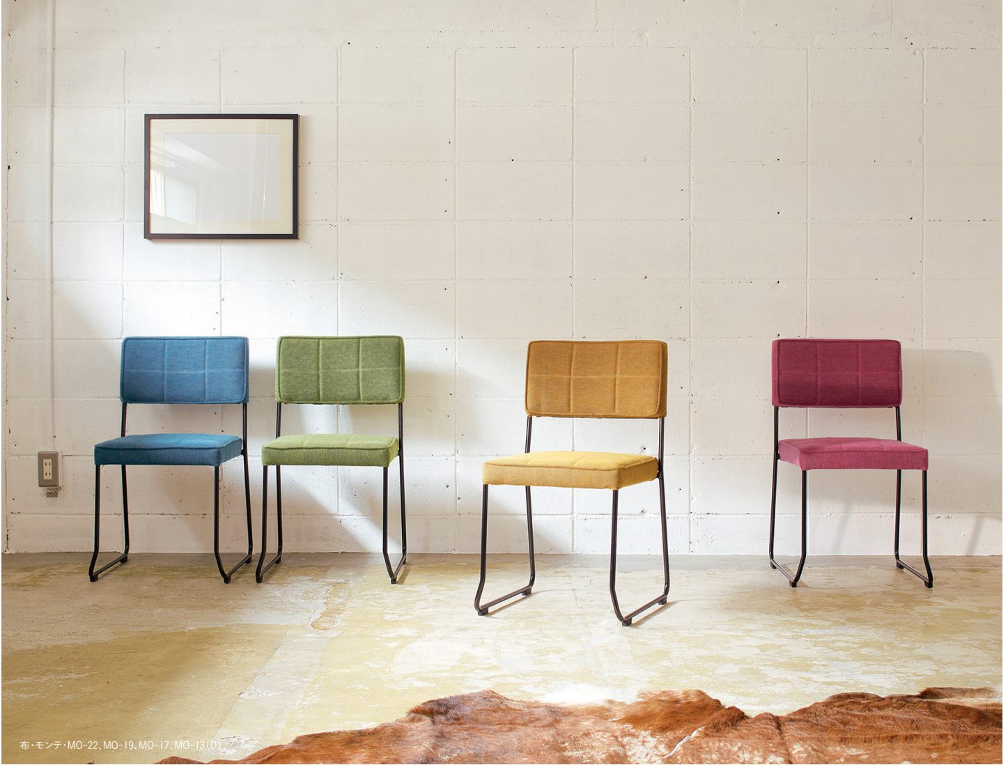
布・モンテ・MO-22, MO-19, MO-17, MO-13 (D)