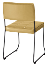
張地: レザー・サンセブン・L-8638(A) ¥39,000