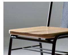
座板は座割り加工されています。