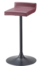
脚：SB-3S 張地：レザー・ カフェフォルテ・モコモW・ L-8321(B) ¥28,800