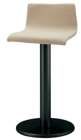
脚：新SB-4S 張地：布・カラーキャンパス・ UP563(B) ¥40,300