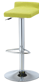
脚：新SB-23・ガス昇降式 張地：布・クオーレ・ #CU04(A) ¥40,000