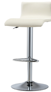
脚：新SB-23・ガス昇降式 張地：レザー・マニエラ・ L-8246(B) ¥43,000