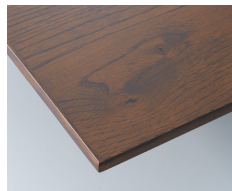
アンティークブラウン

※突板の目や色を最大限に活かす仕上げの為、同じ塗装色でも仕上がりに差が生じます。又、突板には節が混じる場合も有ります。予めご了承下さい。