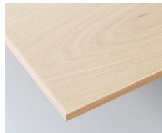
アンティークナチュラル