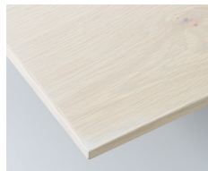
アンティークホワイト