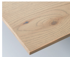
アンティークグレー