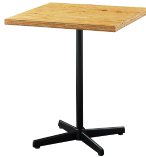
CT-170 + BX-1S(ブラック) W600×D600×H727mm迄 ¥32,200

*ラーチ材の目や色を最大限に活かす仕上げの為、同じ塗装色でも仕上がりに差が生じます。又、表面には節が混じる場合も有り、木口には抜けや色の濃淡が有ります。予めご了承下さい。