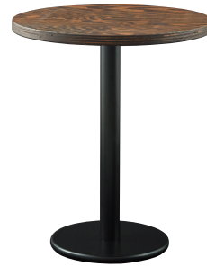
CT-172 + BR-1A(ブラック) 600φ×H727mm迄 ¥39,900