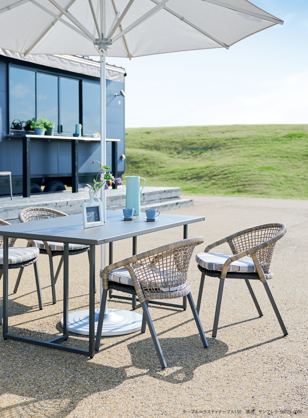
テーブル=ラストイテーブル150 張地: サンプルラ・56079-0000