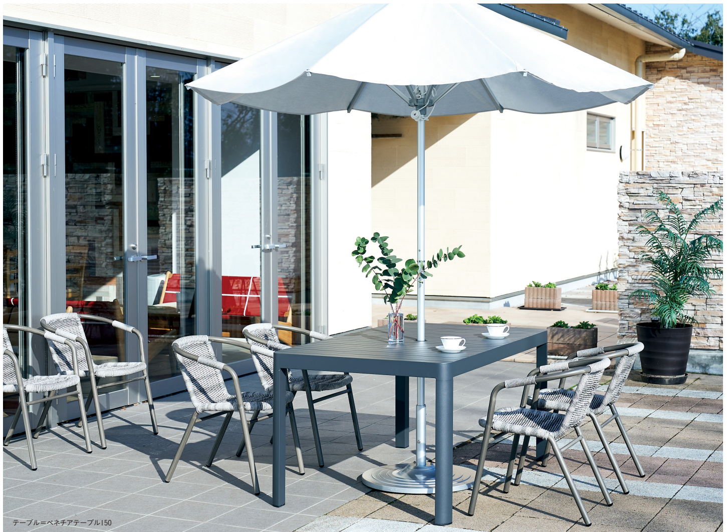
テーブル=ベネチアテーブル150