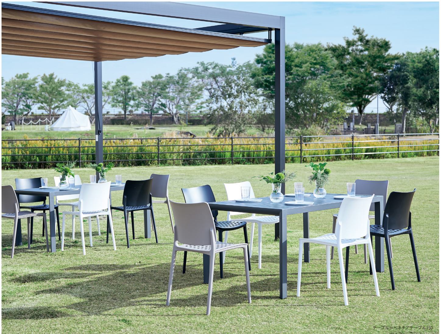
テーブル=ベネチアテーブル150