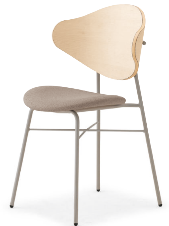
ナプアW2 SI-ML ¥40,600 表材:レザー-C38 (No.5)

◀ナプアM1GL-MX ¥37,200 テーブル:TB2923-YJ-DB (P341)