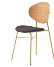
2 GL-MN レザー-C38 (No.13)