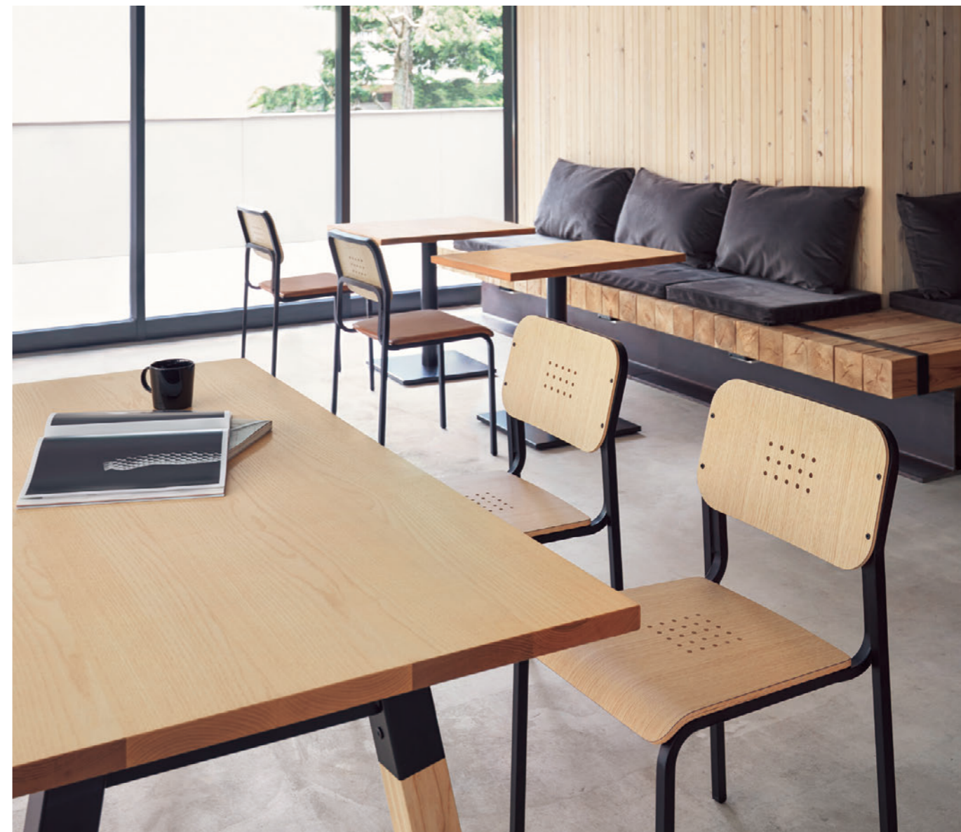
▲レベカ1 BL-MN ¥37,400 レベカ2 BL-MN ¥37,500 張材:レザー-B-25 (No.3) テーブル:TB3046-LN-BL NA-AS (P325) TB3049-EV-BL (P325)