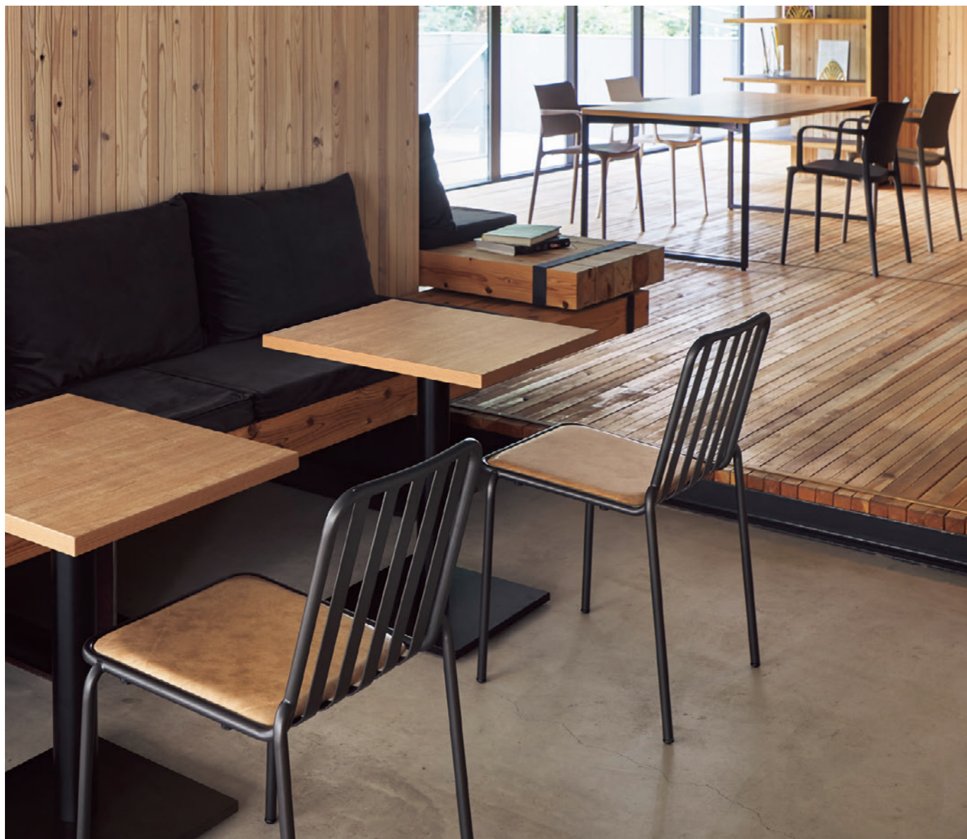
▲ポワロ2 DG ¥28,300 張材:レザー-B-09 (No.2) テーブル:TB3112-EV-BL (P328) 奥のチェア:バーニスWA, WB, WC (P198) 奥のテーブル:FT2-A03-1800W 900D-LE-DG (P309)