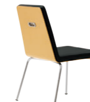
CR-5N レザー-C.22 (No.6)