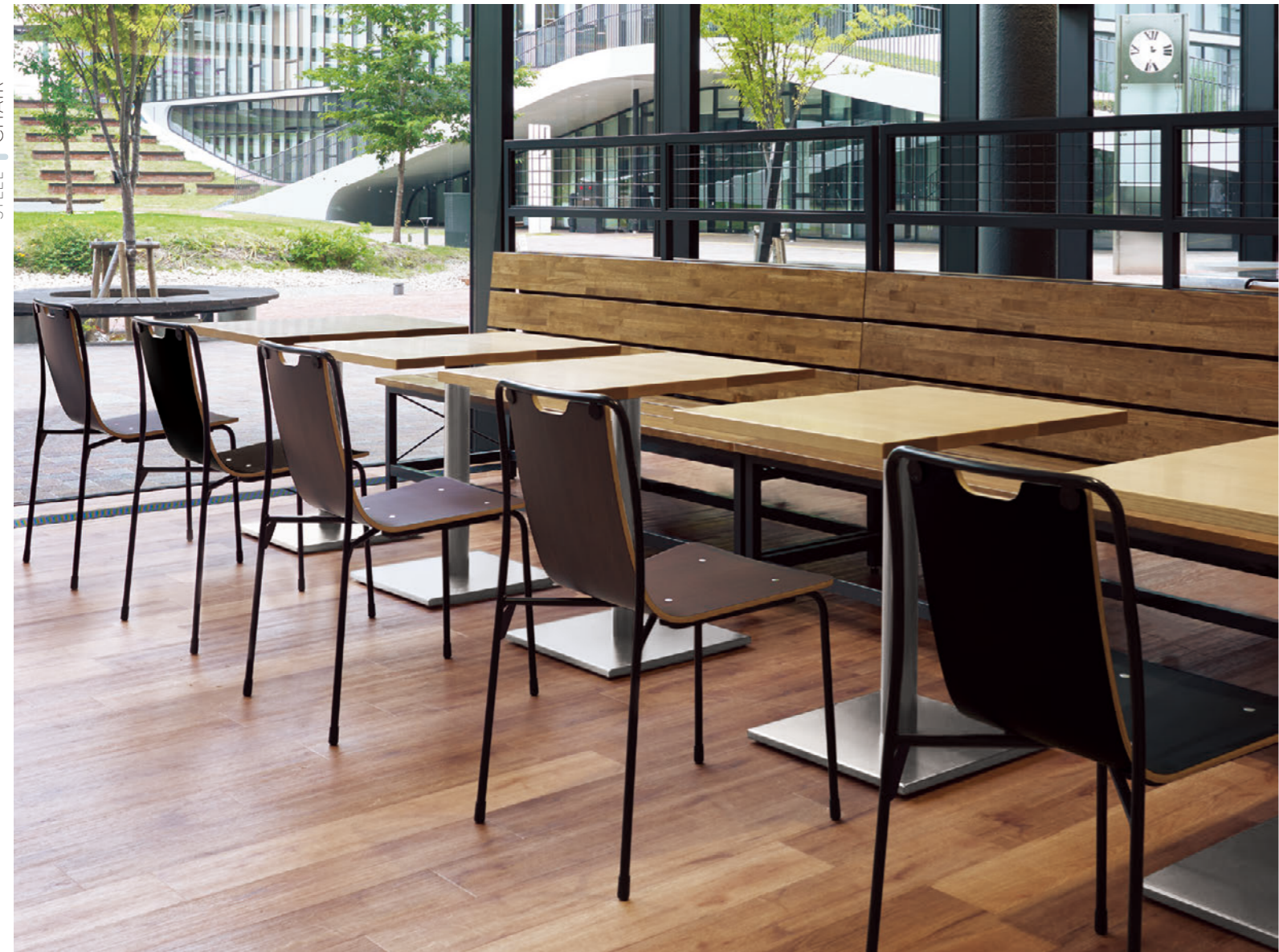
▲ Anita 1 BL-MD Anita 1 BL-MB ¥38,400 テーブル: TB3049 - EV-SI (P325)