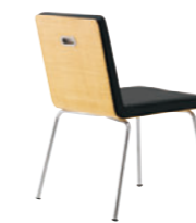
CR-5N レザー-C.22 (No.6)