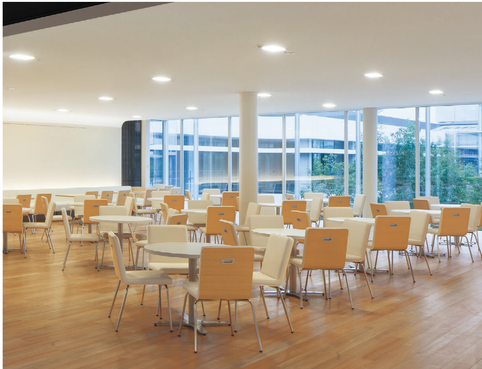
▲ テレス LCR-5N 張材: レザー