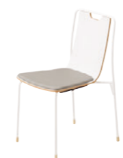
2 WH-MW レザー-A80 (No.91)