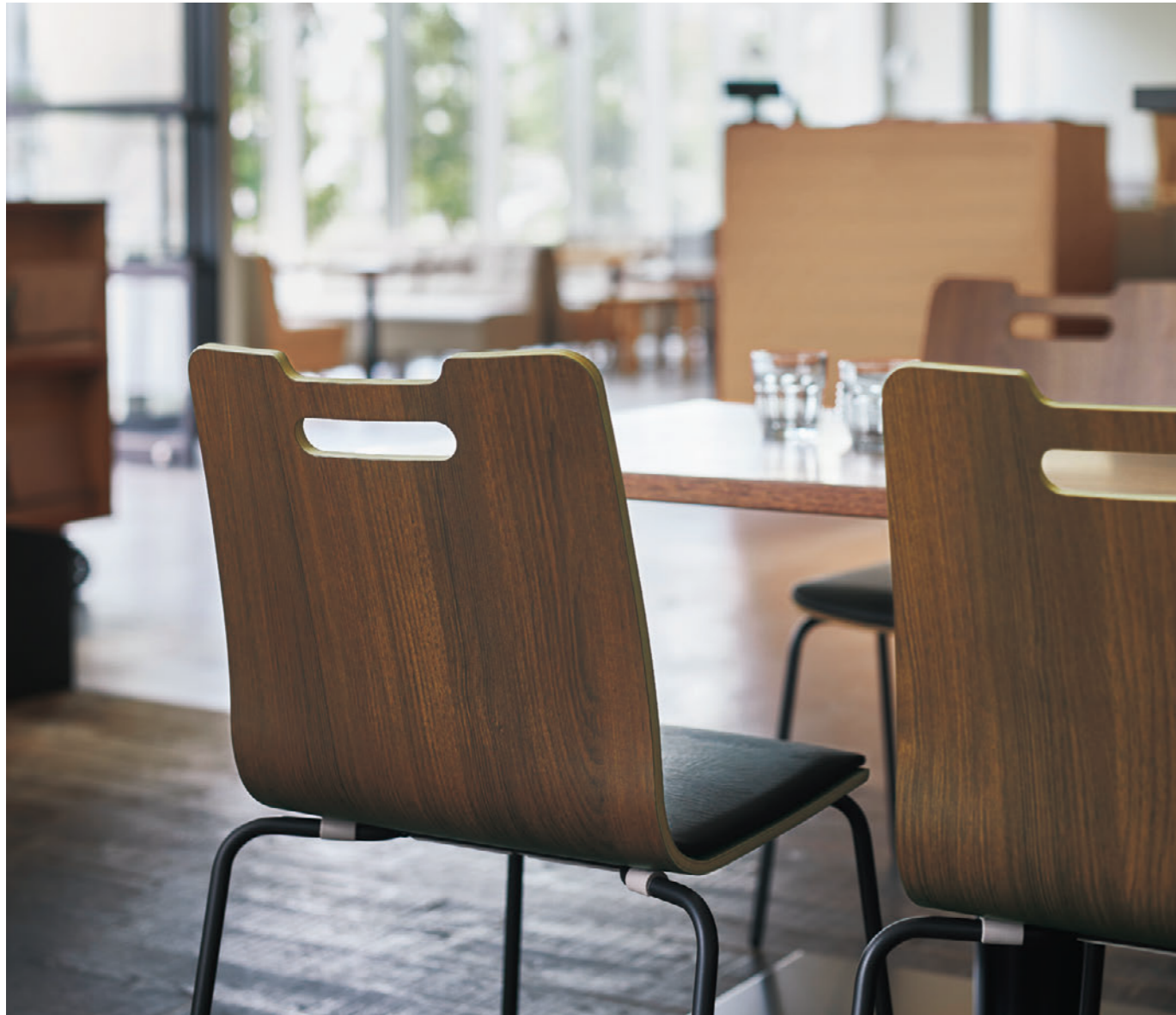
▲ポル2 DG-D ¥43,300 張材:レザー・C-32 (No.6) テーブル:TB3058・EV1-BL (P325)