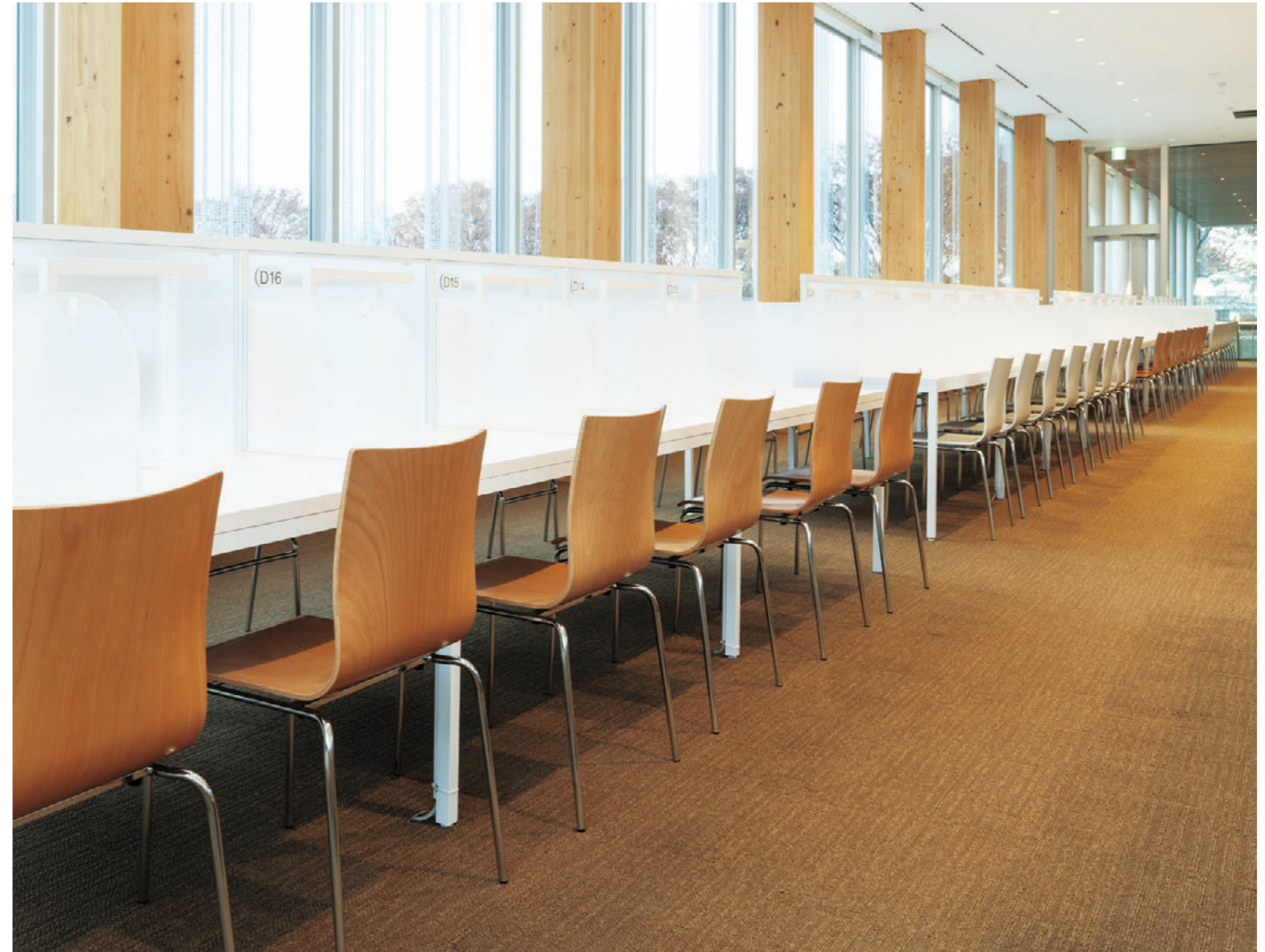
▲フィクスA1 CR-5N フィクスA1 CR-WH ¥28,900