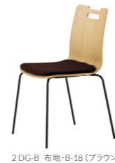
2 DG-B 布地・B-18 (ブラウン)