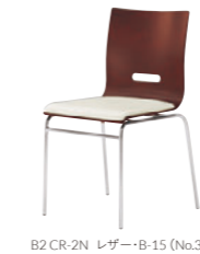
B2 CR-2N レザー・B-15 (No.35)