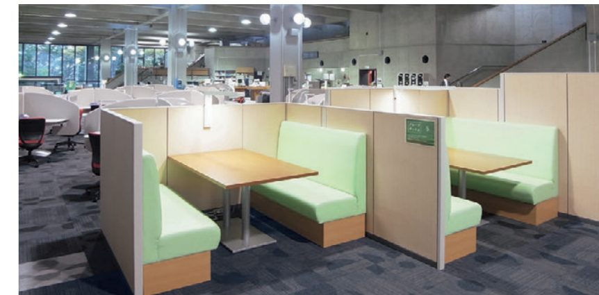
▲バンE1 OM-2-NA バンE1 OM-5-NA 張材:レザー・B-15 (No.25)