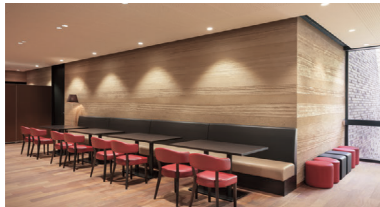
▲バンE1 OM-6 (W1600H950) -BR 張材:レザー・B-15 (No.44) ×B-15 (No.40) テーブル:T18 1N-1200W800D -EV2-BL (P315) チェア:マニコB 1N (P36)