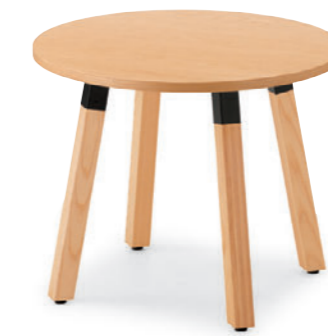
TB3047 - MM-BL NA-AS ¥157,100 900φ 701H 脚部: ¥54,200 天板: ¥102,900 > P325 表面材・アッシュ突板 (板目) 緑材・アッシュ無垢材