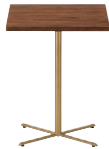
TB3079 - GM-GL ¥38,300 600W 750D 730H/脚650L 脚部: ¥16,800 天板: ¥21,500 > P326 表面材・アカシアハイブリッド集成材