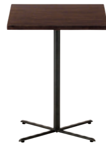
TB3089 - GM-BL ¥38,300 600W 750D 730H/脚650L 脚部: ¥16,800 天板: ¥21,500 > P326 表面材・アカシアハイブリッド集成材

▼FT1-A08-600Φ - GM-GL ¥73,200 728H/脚550L チェア: マニコB1N (P36) 奥のチェア: ランタナW (P190) この頁の商品は完成品がグリーン購入法適合品です。 ※価格は税抜き表示 天板を他のタイプに変更できます。