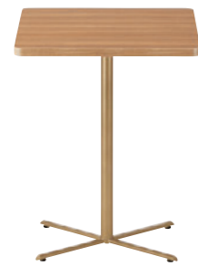
T20 M5-600W 750D - GM-GL ¥39,900 730H/脚650L 脚部: ¥16,800 天板: ¥23,100 > P313 表面材・メラミン化粧板 (抗菌機能付) 緑材・ABS樹脂 (抗菌機能付)