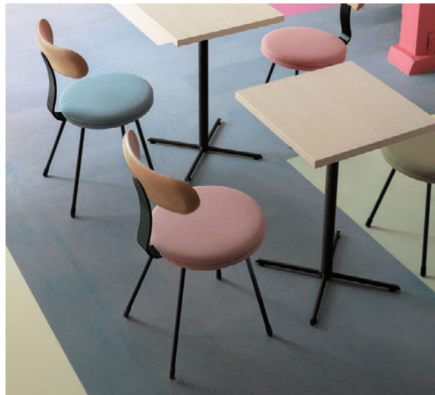
▲FT2-A01 500W 500D - GM-BL ¥34,500 730H チェア: コルビADG-5N (P144)