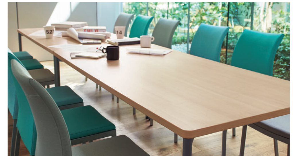
▲T20 M2-1800W 900D - LD-SI ¥100,400 720H ○反り止めパーツ付 チェア: リエカH (P166)