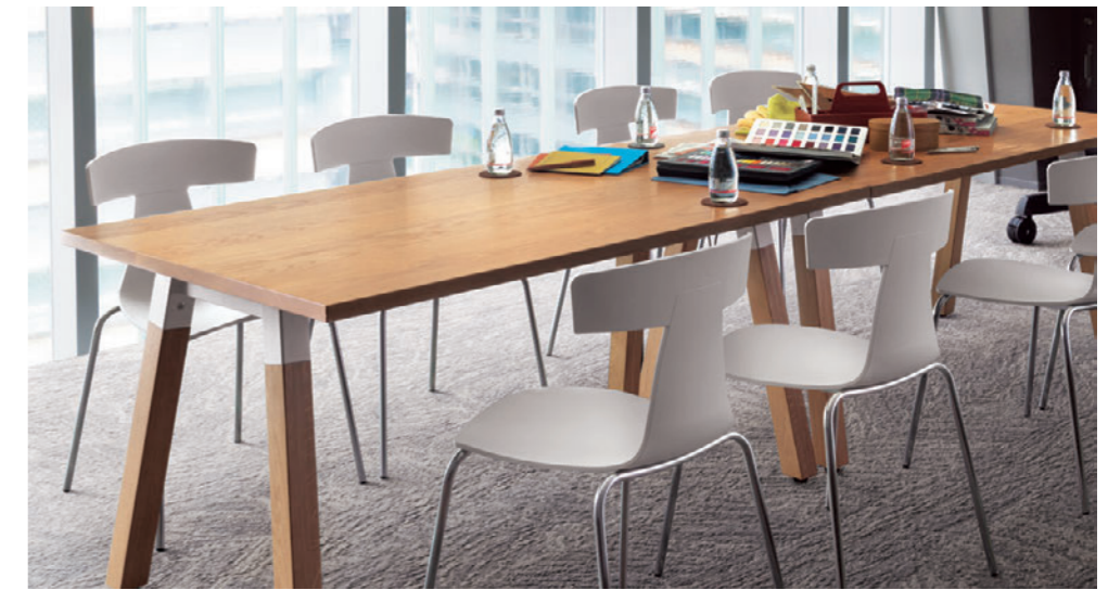
▲TB3006 - LN-WH NA-OA ¥149,000 1500W 900D 701H ○反り止めパーツ付 チェア: ラメCR-A (P184)