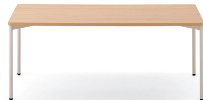
T20 M2-1800W 900D - LD-WH ¥100,400 720H 脚部: ¥29,300 天板: ¥53,900 > P313 表面材・メラミン化粧板 緑材・ABS樹脂 ○反り止めパーツ付