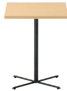
T18 MN-600W 750D - GM-BL ¥39,700 600W 750D 730H/脚650L 脚部: ¥16,800 天板: ¥22,900 > P315 表面材・メラミン化粧板 緑材・ABS樹脂