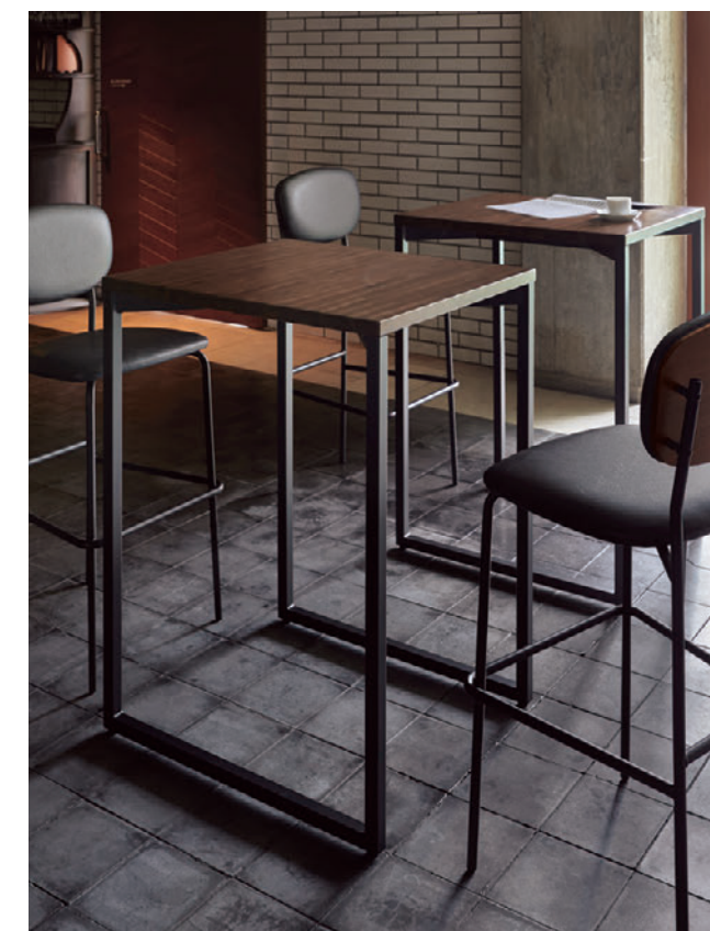
▲TB3079-LEH-DG ¥65,500 600W 750D 1000H チェア:ルベカウンター DG-MX (P231)