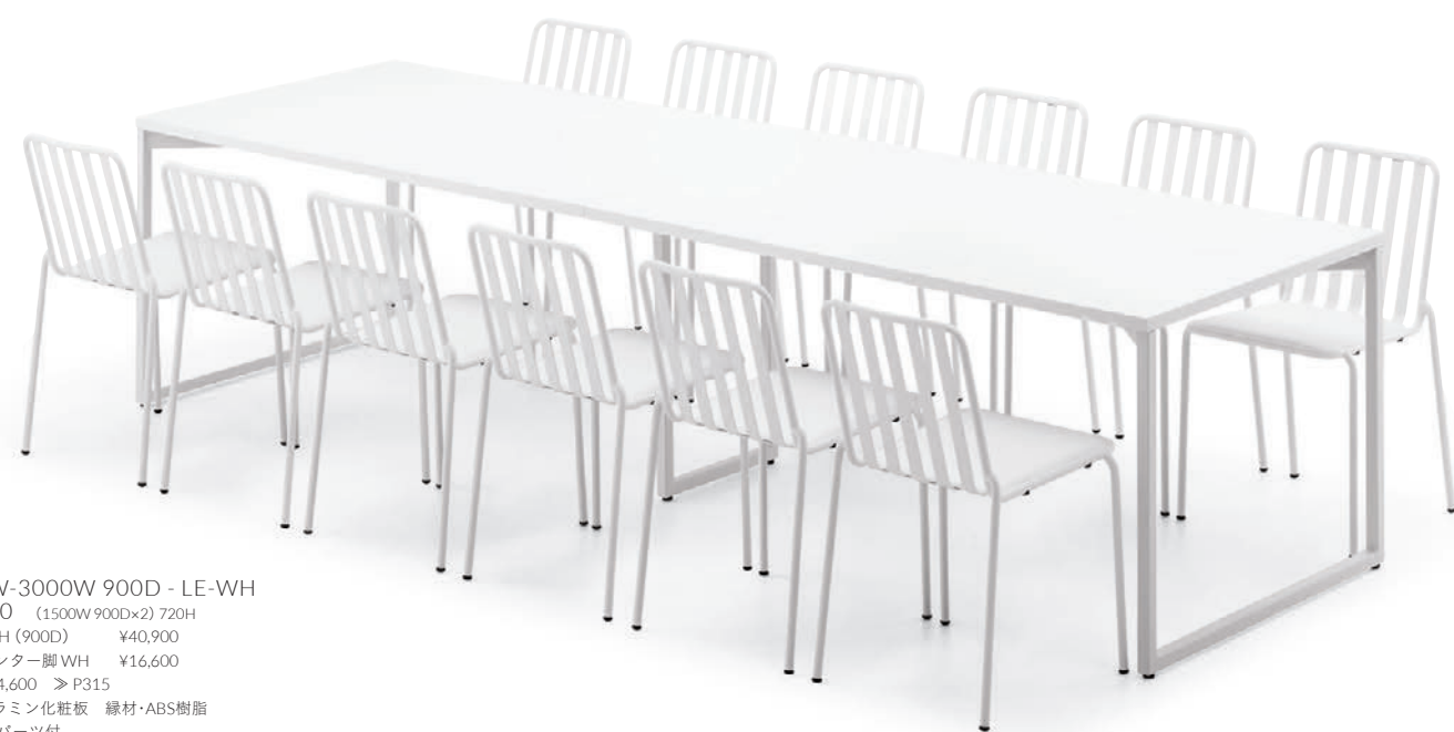
T18 MW-3000W 900D - LE-WH ¥179,300 (1500W 900D×2) 720H 脚部:LE-WH (900D) ¥40,900 LEセンター脚 WH ¥16,600 天板: ¥104,600 > P315 表面材:メラミン化粧板 縁材:ABS樹脂 ○反り止めパーツ付 チェア:ボワロ2WH (P156)