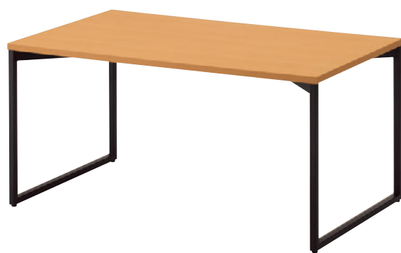
T18 5N-1500W 900D - LE-DG ¥101,800 720H 脚部:¥40,900 天板:¥52,300 > P315 表面材:メラミン化粧板 縁材:ABS樹脂 ○反り止めパーツ付