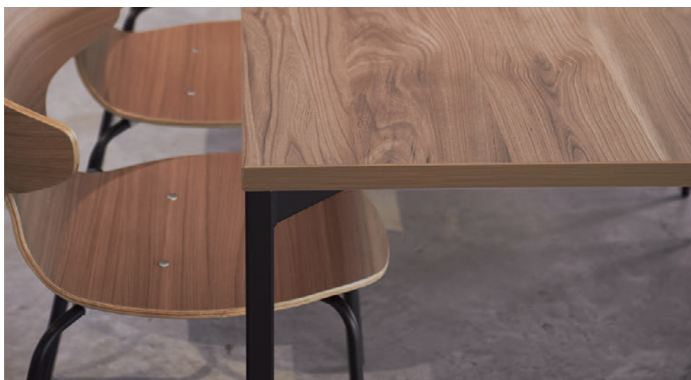
▲FT2-C03-1800W 900D - LE-DG ¥131,700 720H ○反り止めパーツ付 チェア:テモラA1DG-MD (P162)