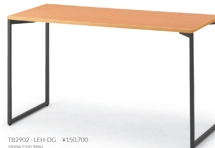
TB2902-LEH-DG ¥150,700 1800W 750D 998H 脚部:¥44,000 天板:¥89,500 > P341 表面材:メラミン化粧板 縁材:ブナ無垢材 ○反り止めパーツ付