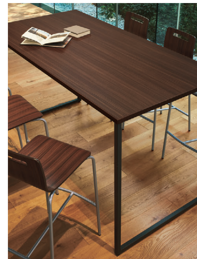
▲TB2922-LEH-DG ¥150,700 1800W 750D 998H ○反り止めパーツ付 チェア:キーンカウンター1SI-MX (P232)