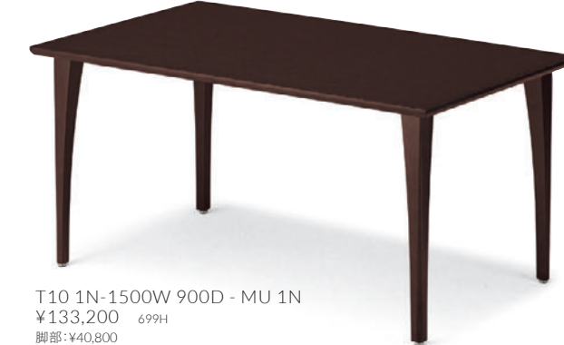
T10 1N-1500W 900D - MU 1N ¥133,200 699H 脚部:¥40,800 天板:¥86,800 > P321 表面材・オーク突板(証目) 緑材・オーク無垢材 ○反り止め金具付