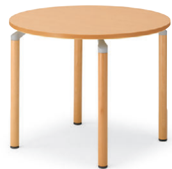
T14 MN-900φ - MBQ-5N ¥83,400 696H 脚部:¥38,800 天板:¥44,600 > P318 表面材・メラミン化粧板 緑材・ABS樹脂