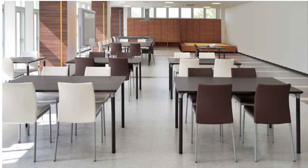
▲T14 MD-1500W 900D - MD-DB ¥111,800 716H ○反り止めパーツ付 T14 MD-900W 900D - MD-DB ¥62,600 716H チェア:リエカL (P166)