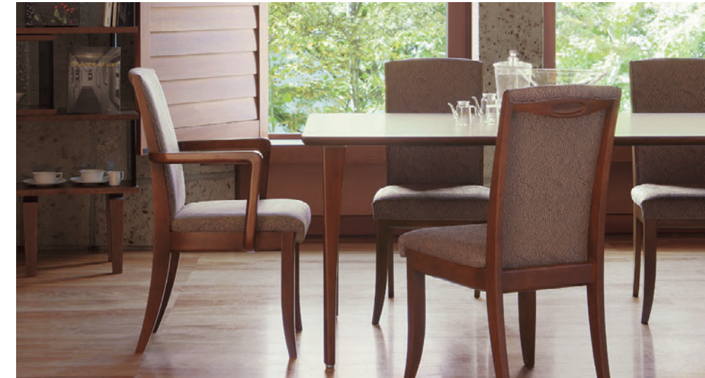
▲T10 3N-1800W 900D - MU 3N ¥195,600 699H ○反り止めパーツ付 チェア:プロテアM、W3N (P93)