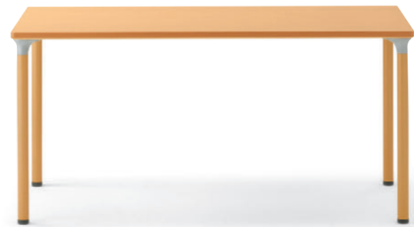
T14 MN-1500W 800D - MD-NA ¥90,200 716H 脚部:¥25,500 天板:¥59,100 > P318 表面材・メラミン化粧板 緑材・ABS樹脂 ○反り止めパーツ付