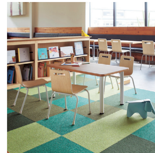
やわらかなエッジは、キッズ用テーブルとしても安心です。 キッズ用テーブルの詳細はP205をご覧ください。