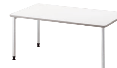
TB2999-MC-C ※MC-CはMC脚のキャスター付です。仕様詳細>>P384