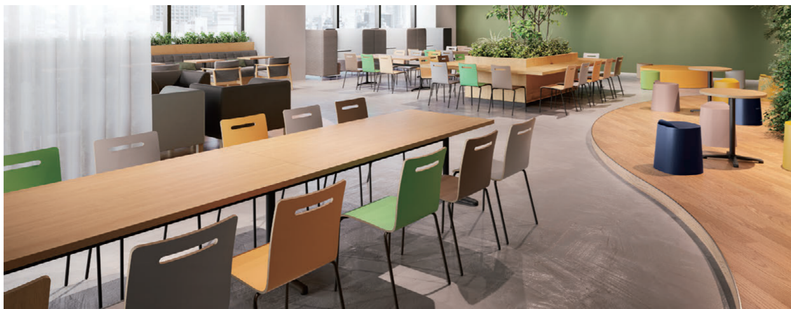
▲TB3133-IF-BL (連結タイプ) チェア:キーン1-BL (P178) 右のテーブル:TB3135-GF-BL ¥47,000 600φ 700H 右のチェア:プラカ (P199)

多様なシーンに使いやすい2種類の抗ウイルス天板。 オフィスや店舗、自宅などあらゆる空間における除菌・ウイルス対策機能のニーズが高まるなか、 食品施設、病院・老健施設、学校（幼・保育園）などの衛生空間にも、特に安心してお選びいただけるシリーズです。