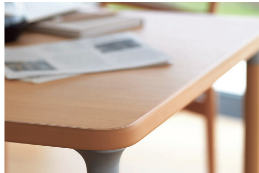
▲TB2973-MD-NA ¥108,100 1800W 900D 720H ○反り止めパーツ付