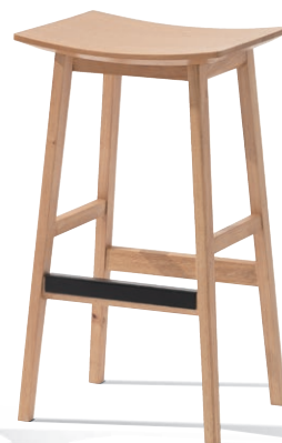
Nocuta Counter Stool