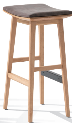
Nocuta Counter Stool Cushion Upholstery No. : UP905