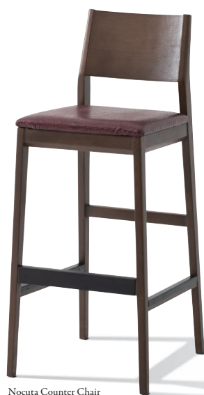
Nocuta Counter Chair Upholstery No. : Discontinued