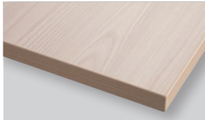
White wood ホワイトウッド (WH)