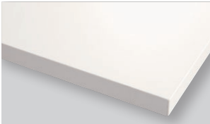
White ホワイト (HT)