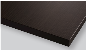
Dark brown ダークブラウン (WD)