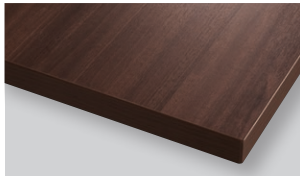
Cafe brown カフェブラウン (WC)