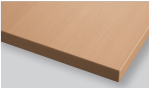
Light brown ライトブラウン (WL)