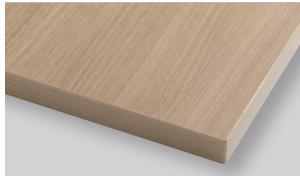
Light brown Vintage ライトブラウンヴィンテージ (WLW)