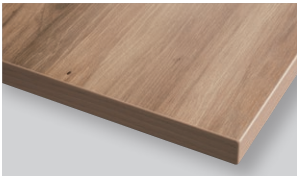
Old wood オールドウッド (WF)