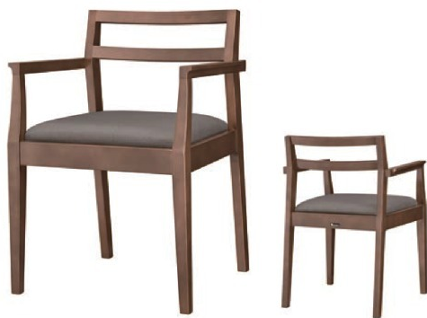
1176 伊東 D アーム椅子 張地：マニエラ L-8262 (Bランク)