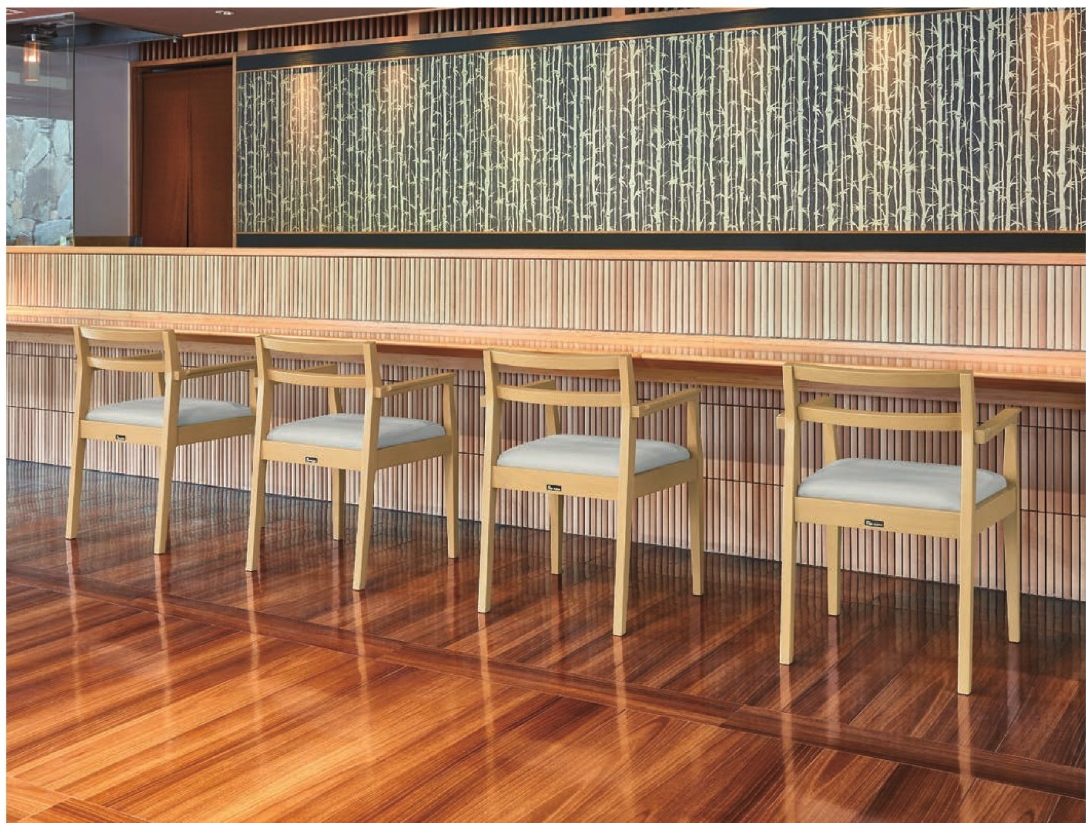
張地／カラー／レット UP-1113 (Aランク)