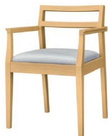
1076 伊東 N アーム椅子 張地：シルキークラスタル UP-763 (Bランク)