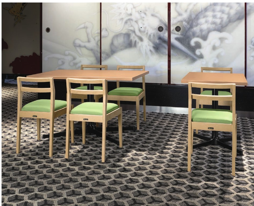
脚部 4318 天板 9305 HX- 太子Nテーブル W1200 × D750 × H700mm / 脚部 4310 天板 9300 HX- 太子Nテーブル W600 × D750 × H700mm 【P140 記載】 張地 / プレザント PL-61 (Aランク)