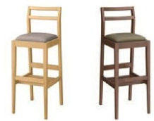
1175 伊東 D 椅子 張地：デニムⅡ UP-872 (Bランク)