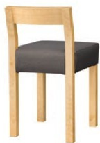
1165 小百合 D 椅子 張地 : 松葉 L UP-1002 (Cランク)