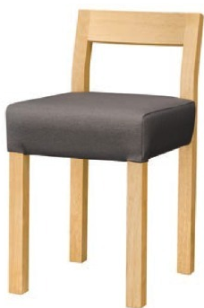
1065 小百合 N 椅子 張地 : マニエラ L-8262 (Bランク)