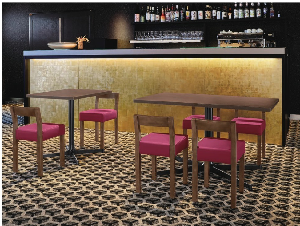
脚部 4310 天板 9210 HX- 大間 D テーブル W600 × D750 × H700mm / 脚部 4318 天板 9215 HX- 大間 D テーブル W1200 × D750 × H700 【P141 記載】 張地 / クレンスII L-8541 (Aランク)