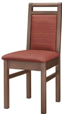
1296-1925 対馬 D 椅子 張地: デコア L-8145 (Bランク)