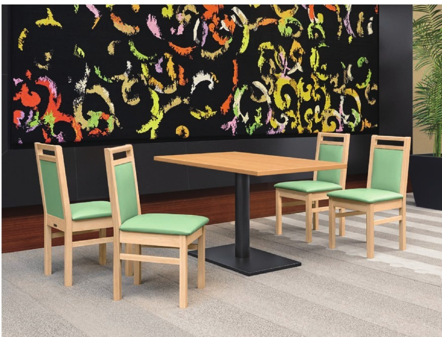
脚部 4308 天板 9205 HR-大間Nテーブル W1200×D750×H700mm【P141 記載】 張地/クレンズII L-8508 (Aランク)