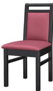
1396-1925 対馬 B 椅子 張地: 色舞 SH-10 (Bランク)