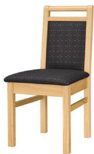
1096-1925 対馬 N 椅子 張地: 麻葉繁 UP-997 (Cランク)