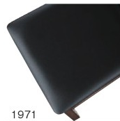
1971 黒レザー (既製品) 張地 / オールマイティール-8671 (シンコール)