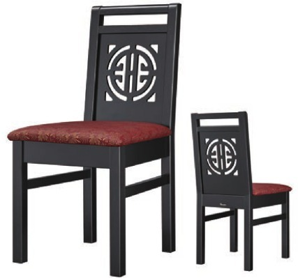
1396-1776 周荘 B 椅子 張地: 松葉 L UP-1000 (Cランク)