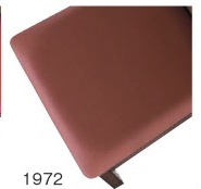
1972 茶レザー (既製品) 張地 / オールマイティール-8669 (シンコール)