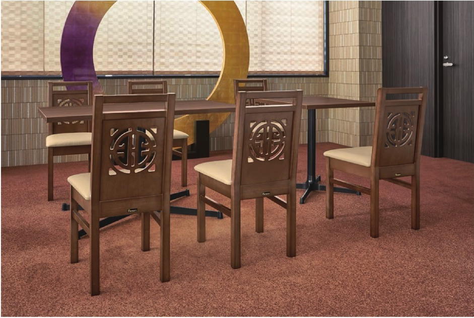
脚部 4318 天板 9215 HX-大間Dテーブル W1200×D750×H700 / 脚部 4310 天板 9210 HX-大間Dテーブル W600×D750×H700mm 【P141 記載】 張地 / クレズII L-8523 (Aランク)