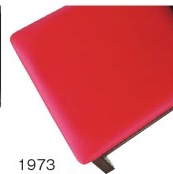
1973 赤レザー (既製品) 張地 / オールマイティール-8698 (シンコール)