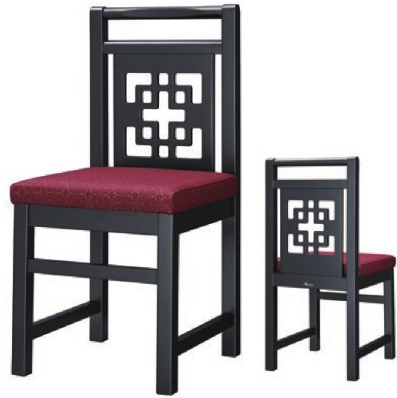
1340-1687 青島 B 椅子 張地: 麻葉繁 UP-995 (Gランク)