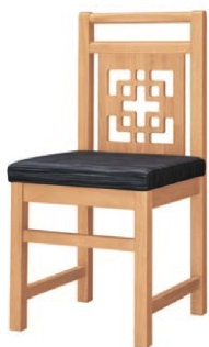
1040-1685 青島 N 椅子 張地: デコア L-8151 (Bランク)