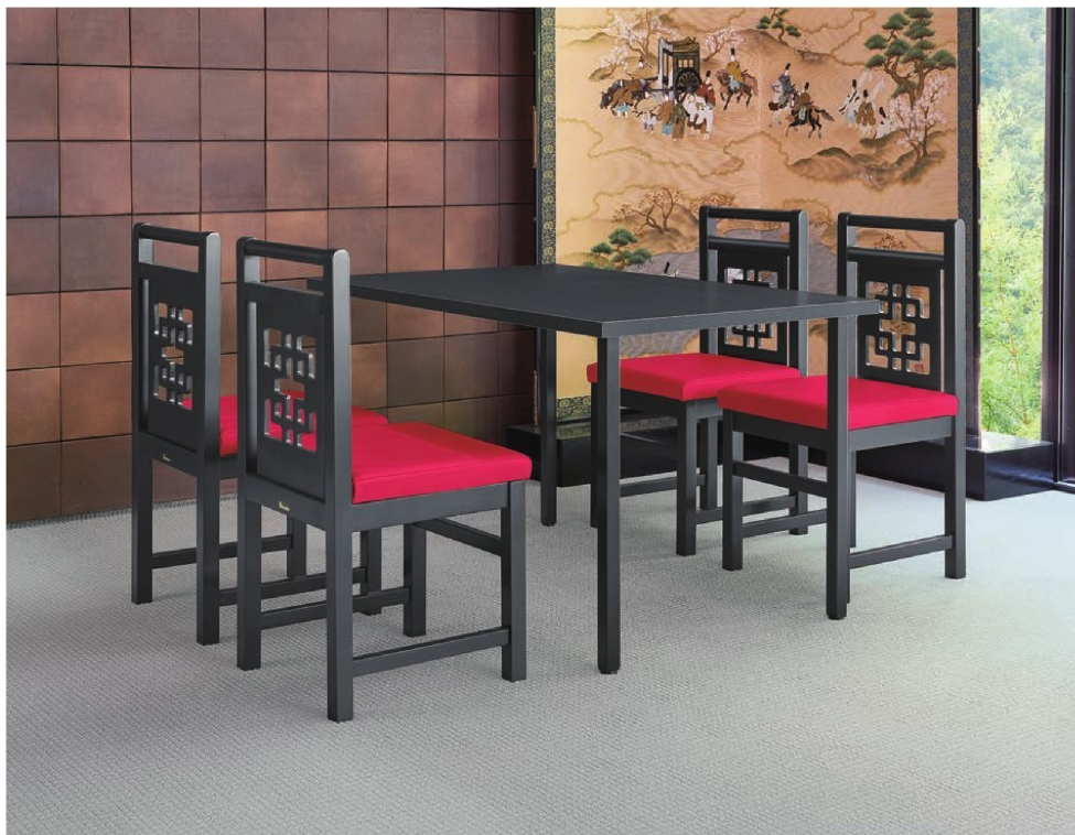
脚部 4150 天板 9325 HI-太子 B テーブル W1200 × D750 × H700mm 【P140 記載】 張地 / カラーバレット UP-1118 (Aランク)