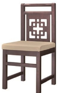
1140-1686 青島 D 椅子 張地: マニエラ L-8258 (Bランク)