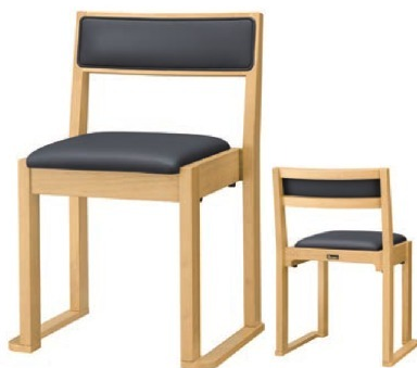
1025 宮津 N 椅子 張地 : クレンスII L-8534 (Aランク)