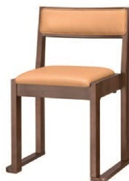
1225 宮津 D 椅子 張地 : プレザント PL-15 (Aランク)