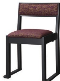
1325 宮津 B 椅子 張地 : 松葉 L UP-1001 (Cランク)