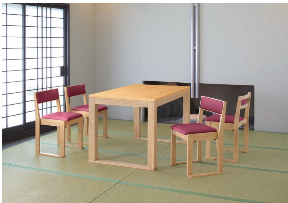
脚部 4370-4970 天板 9908 H 長門I N ソリ付-長門 N テーブル W1200 × D750 × H700 mm 【P134 記載】 張地 / クレンスII L-8541 (Aランク)