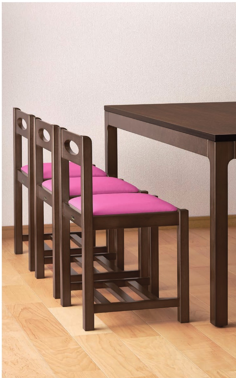
脚部 4383 天板 9940 H 長門II D-長門 D テーブル W1500 × D750 × H700mm 【P133 記載】 張地/プレザント PL-33 (Aランク)