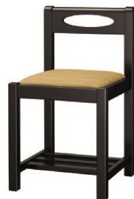
1232 室生 B 椅子 張地: デコア L-8149 (Bランク)