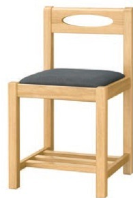
1032 室生 N 椅子 張地: デニムII UP-873 (Bランク)