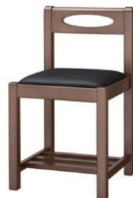
1132-1899 室生 D 椅子 張地: 黒レザー (既製品)