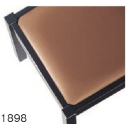
1898 茶レザー (既製品) 張地: クレンスII L-8532 (シンコール)