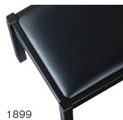
1899 黒レザー (既製品) 張地: クレンスII L-8534 (シンコール)