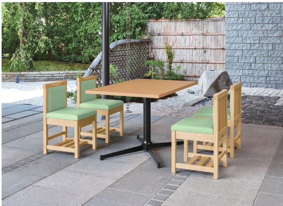
脚部 4318 天板 9305 HX- 太子Nテーブル W1200 × D750 × H700mm【P140 記載】 張地/クレンズII L-8508 (Aランク)