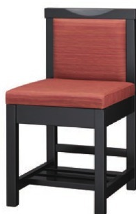
1310-1905 宇陀 B 椅子