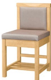
1010-1905 宇陀 N 椅子