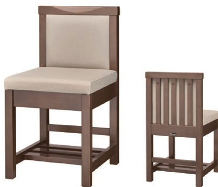
1210-1905 宇陀 D 椅子