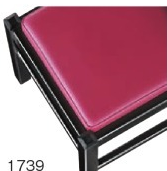
1739 赤レザー (既製品) 張地: オールマイティー-L-8704 (シンコール)