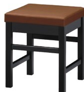
1395-1839 天竜 B 椅子 張地: 茶レザー (既製品)