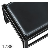
1738 黒レザー (既製品) 張地: オールマイティー-L-8671 (シンコール)