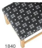
1840 カスリレザー (既製品) 張地: カスリ