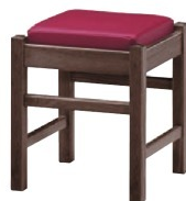
1193-1739 弥山 D 椅子 張地: 赤レザー (既製品)