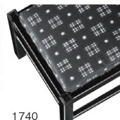
1740 カスリレザー (既製品) 張地: カスリ