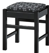
1393-1740 弥山 B 椅子 張地: カスリレザー (既製品)