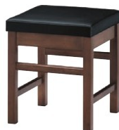
1195-1841 天竜 D 椅子 張地: 黒レザー (既製品)