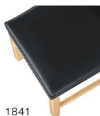
1841 黒レザー (既製品) 張地: クレンスII L-8534 (シンコール)