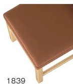
1839 茶レザー (既製品) 張地: クレンスII L-8532 (シンコール)