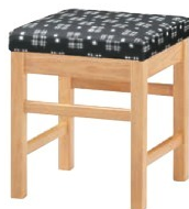
1095-1840 天竜 N 椅子 張地: カスリレザー (既製品)