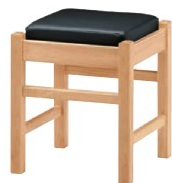
1093-1738 弥山 N 椅子 張地: 黒レザー (既製品)