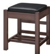
1152-1738 葛城 D 椅子 張地: 黒レザー (既製品)