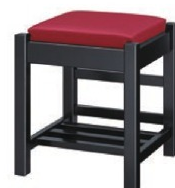
1352-1739 葛城 B 椅子 張地: 赤レザー (既製品)