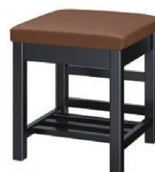
1350-1839 伊賀 B 椅子 張地: 茶レザー (既製品)