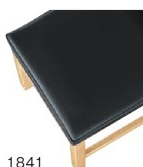
1841 黒レザー (既製品) 張地: クレンスⅡ L-8534 (シンコール)