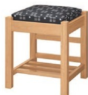
1052-1740 葛城 N 椅子 張地: カスリレザー (既製品)