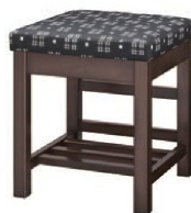
1150-1840 伊賀 D 椅子 張地: カスリレザー (既製品)