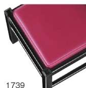
1739 赤レザー (既製品) 張地: オールマイティー L-8704 (シンコール)