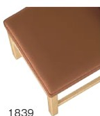
1839 茶レザー (既製品) 張地: クレンスⅡ L-8532 (シンコール)