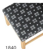
1840 カスリレザー (既製品) 張地: カスリ