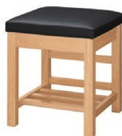
1050-1841 伊賀 N 椅子 張地: 黒レザー (既製品)