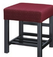
1354 宮滝 B 椅子 張地: 麻葉藝 UP-995 (Cランク)