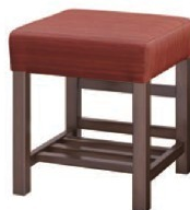
1154 宮滝 D 椅子 張地: デコア L-8145 (Bランク)