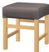
1033 保津 N 椅子 張地: マニエラ L-8262 (Bランク)