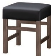
1133 保津 D 椅子 張地: クレンズⅡ L-8534 (Aランク)