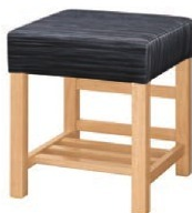
1054 宮滝 N 椅子 張地: デコア L-8151 (Bランク)