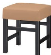
1233 保津 B 椅子 張地: クレンズⅡ L-8529 (Aランク)