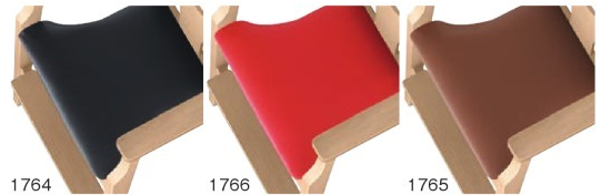
1764 黒レザー (既製品) 張地: オールマイティ L-8671 (シンコール)