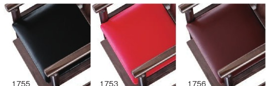
1755 黒レザー (既製品) 張地: ニュートップ L-8566 (シンコール)