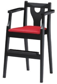
1344-1766 イルカ B 椅子 張地: 赤レザー (既製品)