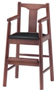
1241-1755 パンダ K 椅子 張地: 黒レザー (既製品)