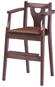
1144-1765 イルカ D 椅子 張地: 茶レザー (既製品)