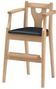
1044-1764 イルカ N 椅子 張地: 黒レザー (既製品)