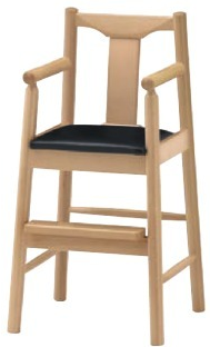
1041-1755 パンダ N 椅子 張地: 黒レザー (既製品)