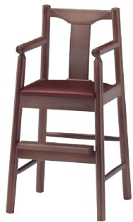
1141-1756 パンダ D 椅子 張地: 茶レザー (既製品)