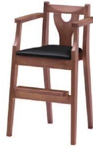
1244-1764 イルカ K 椅子 張地: 黒レザー (既製品)