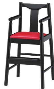
1341-1753 パンダ B 椅子 張地: 赤レザー (既製品)