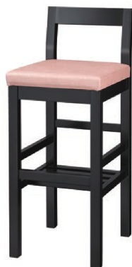
2318 吉野 B スタンド椅子 張地 : シルキーラスタル UP-773 (Bランク)