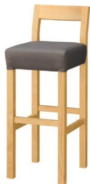
2065 小百合 N スタンド椅子 張地 : マニエラ L-8262 (Bランク)

主 材 / ラバーウッド 塗装色 / N : ナチュラルクリヤ / D : ダークブラウン / B : ブラック