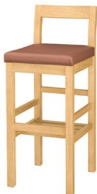
2018 吉野 N スタンド椅子 張地 : マニエラ L-8275 (Bランク)

主 材 / ラバーウッド 塗装色 / N : ナチュラルクリヤ / D : ダークブラウン / B : ブラック