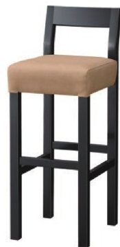
2265 小百合 B スタンド椅子 張地 : デニム II UP-870 (Bランク)