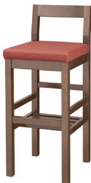
2218 吉野 D スタンド椅子 張地 : デコア L-8145 (Bランク)