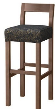
2165 小百合 D スタンド椅子 張地 : 松葉 L UP-1002 (Cランク)