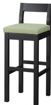
2266 小町 B スタンド椅子 張地: デコア L-8148 (Bランク)

椅子は、031 ページをご覧ください。カウンター椅子は、127 ページをご覧ください。