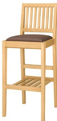
2030 那須 N スタンド椅子 張地: マニエラ L-8276 (Bランク)