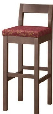
2166 小町 D スタンド椅子 張地: 松葉 L UP-1000 (Cランク)