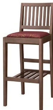
2230 那須 D スタンド椅子 張地: 松葉 L UP-1000 (Cランク)