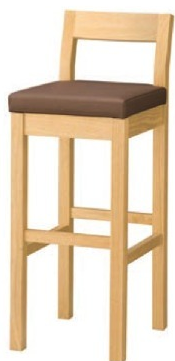
2066 小町 N スタンド椅子 張地: マニエラ L-8276 (Bランク)